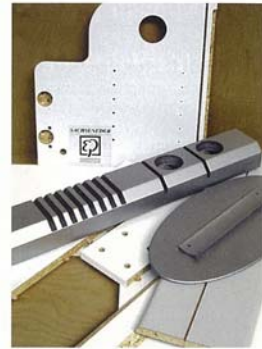
Bild links oben: Lackierung Unterhaltungselektronik. Bild links unten: Dreischicht in Laubholz. Bild rechts oben: Möbelteile

dustrie bewiesen hat. Vom einfachen Zuschnitt bis hin zu aufwändig furnierten und bearbeiteten Möbelteilen wird jegliche Form der Holzbearbeitung angeboten. Dies umfasst Zuschnitt, Kantenbearbeitung, Fräsen, Bohren und Dübeln und reicht hin bis zur fertigen Oberfläche. Der Bereich Industrielackierung rundet das Angebot noch weiter ab. Hier kann Sachseneder auf 50 Jahre Erfahrung im Bereich Lackierung und Oberflächenbeschichtung zurückgreifen. Das Spektrum reicht von der einfachen Klarlacklackierung bis hin zu Ledereffekt bzw. Softfeel-Lackierungen, die auf allen gängigen Kunststoffen und Holzwerkstoffen aufgetragen werden. www.sachseneder.at